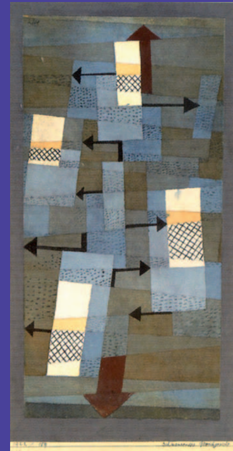
Paul Klee - Schwankendes Gleichgewicht 1922 [Swaying balance]

Organized by Sciences Po Lille & Cahiers d'Economie Politique/Papers in Political Economy with the support of CLERSE, University Lille 1 & Charles Gide.