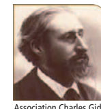
Association Charles Gide